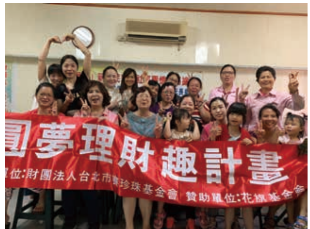
執行長（前排左二）於結業式時鼓勵學員們，課程結束後能繼續朝夢想邁進。