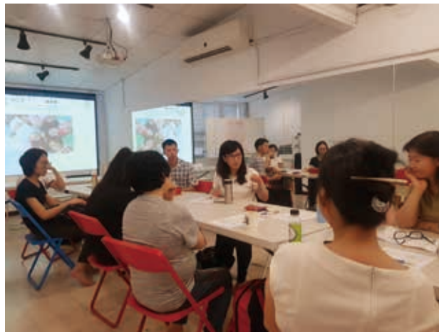
志工們討論服務中遇到的困難與心得。