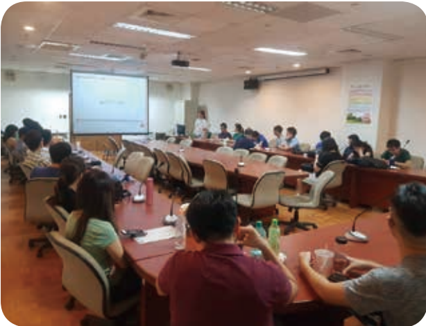
7月9日本會與中興醫院合辦「畢業後一般醫學訓練」課程