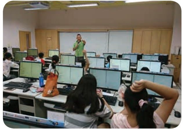
6月30日於萬華新移民會館辦理兒童電腦課