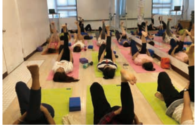
學員一起練習瑜珈動作。

在本會扶助家庭中，新移民媽媽們在大多從事高勞動性之工作，平常承受著生活和經濟壓力，又缺乏家人和朋友等支持系統的關懷協助，在多重的壓力下易導致內心產生負面情緒及想法，但當遇到身心靈出現狀況或生病時，這些媽媽們往往都會選擇隱忍不願就醫治療，為生活奔波忙碌而疏於照顧自己的健康。因此我們今年特別開設「健康樂活動一動」瑜珈課程，讓媽媽們能在忙碌的生活中放鬆身心靈，也能藉此提升自我照顧意識，強化自我照護的能力。