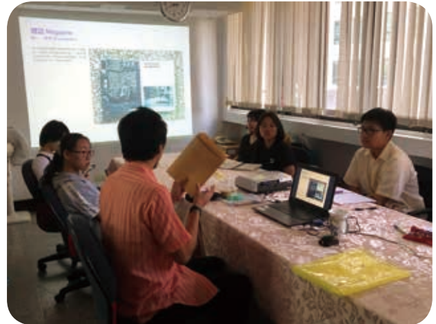
7月13日在本會舉辦新二代策展工作坊