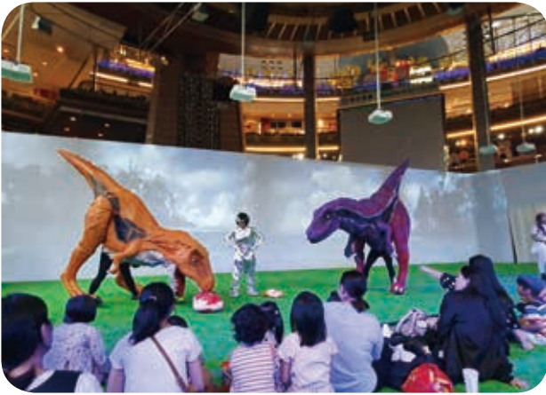
6月26日獲邀欣賞京華城吼吼星球偶裝互動故事屋演出