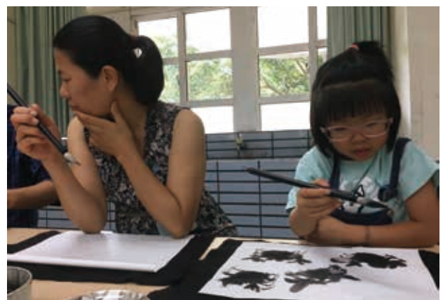
學員專注創作彩墨畫。