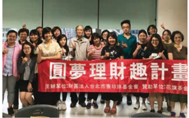
學員於結業式大合照。

陪伴她熟悉記帳的方法，一次次地帶著她檢核帳本的錯誤，現在的她已經養成了良好的記帳習慣，甚至發現真的因為記帳而存到了錢，因而愛上了記帳，變得非常有信心能夠透過良好的理財習慣，存下房子的頭期款，往夢想前進一大步。