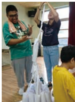
學員運用白紙與迴紋針蓋大樓。

「攀岩體驗」：已經沒有力氣的菁菁仍然倔強的攀附在岩壁上，不肯放棄，她含著眼淚說「在家裡，爸爸說我什麼事都做不好，所以我想要做好，我想要爬上去。」