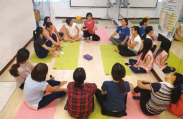
瑜珈課後，學員圍成一圈分享自己的心得感想。