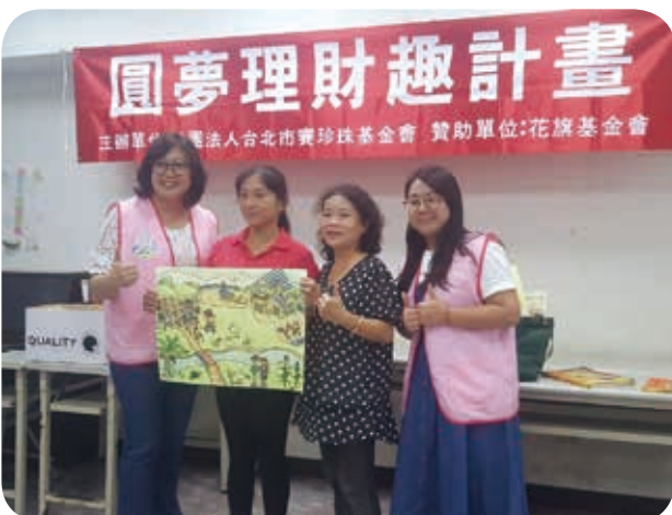
7月27日屏東縣幸福理財帳本77期結業式