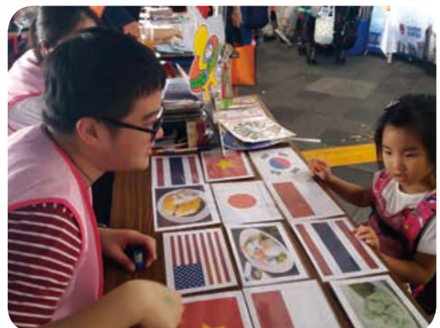
8月8日參加中山區友善園遊會宣導擺攤