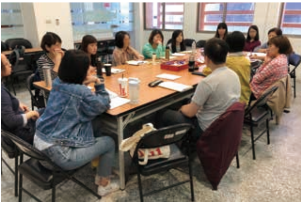
學員分享帶領服務對象記帳的心得。

不同於團體式的記帳課程，金融社工財務知能課程連結的是較無法外出上課的學員，由社工帶領，針對學員個人的需求進行記帳課程。這常常都需要社工花費心思設計課程，並透過團體督導課，與擁有豐富知識、經驗的督導共同討論，去思考如何找到最適合學員的記帳方式，和解決其財務問題的方式。其中一位學員，一開始非常不習慣記帳，常常忘記或是因為搞不清楚帳本的分類方法而沒有記帳，不過社工非常有耐心的