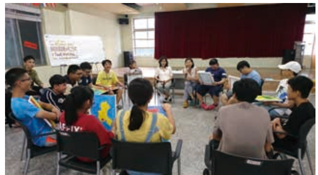
學員與講師分享內心故事與體驗心得。

啊！我在文字中感受到這孩子的溫柔，也看到他的勇敢與突破，他願意將自己放在新的環境裡，嘗試改變與挑戰。孩子的回饋，給我們更多鼓勵，讓我們知道他們有所成長，有所學習，我們一起在做讓我們更好的事！體驗之餘，歡笑之後，我們更希望給孩子能帶著走的能力，勇敢的面對陌生與未知，嘗試各種方法，增進對生命與學習的熱忱！